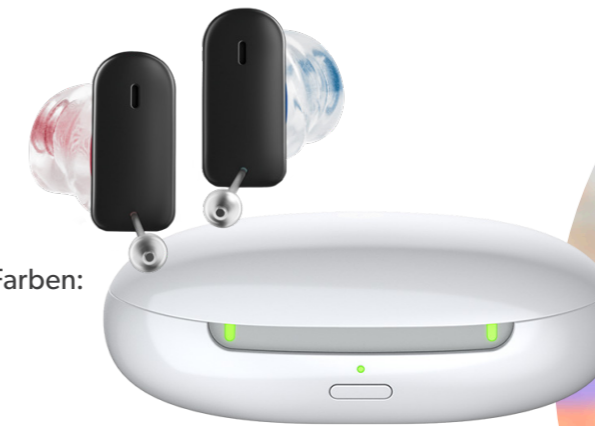
Mobiles Ladeetui für 3 mal laden