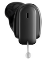
Insio Charge&Go CIC*